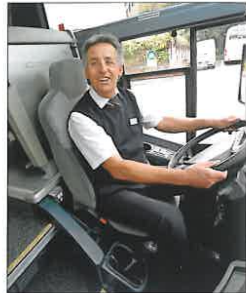
Abb.3: Genehmigungen im Fernbuslinienverkehr sollten zum Schutz der Beschäftigten ebenfalls von der Einhaltung adäquater Sozialstandards abhängig gemacht werden.

Ein Kernthema im Bereich des ÖPNV ist der obligatorische Beschäftigtenübergang mit einheitlichen Standards beim Wechsel des Betreibers. Das ergibt sich nicht nur aus den Empfehlungen des EU-Parlaments vom Februar 2014 und den Empfehlungen der europäischen Sozialpartner zur Schaffung adäquater Sozialstandards in der ÖPNV-Branche. Auch die praktischen Vorteile sprechen dafür. Die konsequente Anordnung eines Beschäftigtenübergangs sorgt bei den Beschäftigten für Sicherheit und für die Unternehmen eine verlässliche Kalkulationsgrundlage wird geschaffen. Darüber hinaus erleichtert ein Beschäftigtenübergang die Betriebsaufnahme durch den neuen Betreiber. Statt neue Mitarbeiter suchen und einarbeiten zu müssen, kann dieser weitgehend