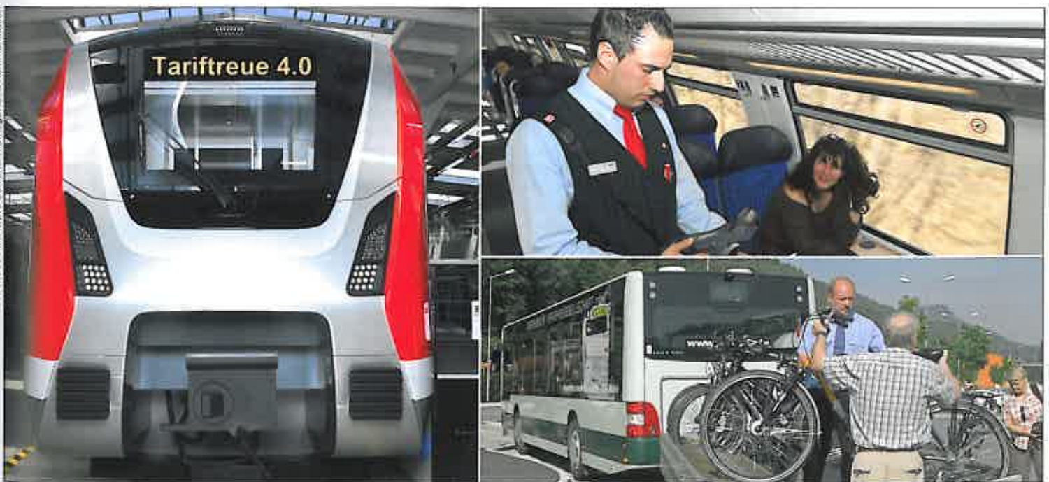
Abb. 1: Der ÖPNV ist in den Tariftreuregelungen der Länder gesondert geregelt. In vielen Ländern wird die bestehende Gesetzgebung derzeit evaluiert, in anderen sind Evaluierungen vorgesehen. Das sollte genutzt werden, um die Regelungen im Sinne einer „Tariftreue 4.0“ qualitativ zu verbessern und praxisnäher zu gestalten

gierung aus CDU und SPD hat sich im Koalitionsvertrag auf die Verabschiedung eines solchen Gesetzes festgelegt. In Sachsen-An-