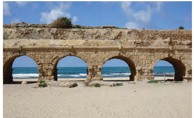
Blick auf den wichtigsten Verkehrsweg des Mittelalters: Das Mittelmeer. Im Vordergrund der römische Aquädukt von Caesarea

Ich habe dort auch zwei Vorträge, je einen im rechtshistorischen Doktorandenseminar und im wöchentlichen Lunchtalk-Programm der Fakultät, gehalten und die Gelegenheit genutzt, mit dem Dekan unsere Diskussion darüber, wie universal das mittelalterliche Handelsrecht war, fortzusetzen. Er selbst vergleicht den Handel im Mittelmeer mit jenem im indischen Ozean, eine Perspektive, die uns ganz fehlt, aber aus israelischer Sicht definitiv sinnvoll ist.